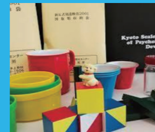
対象年齢：新版 K 式発達検査 (未就学児用)